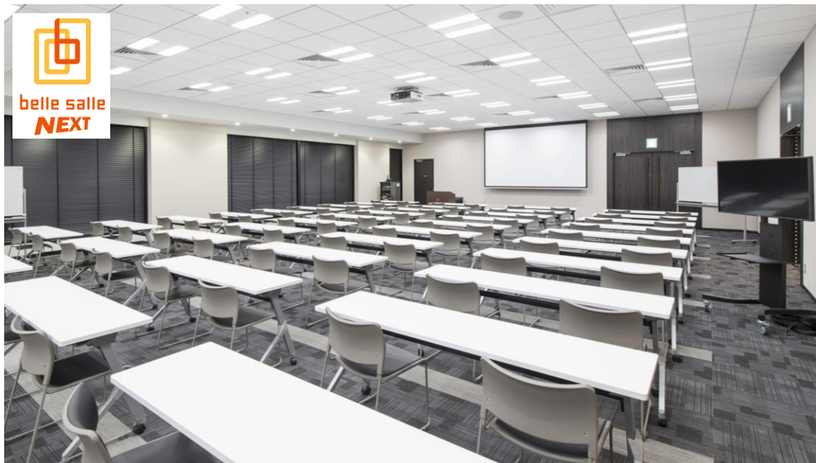
<貸会議室イメージ>

都営大江戸線・浅草線「大門」駅 徒歩 2 分の良好なアクセス環境に『ベルサール NEXT 浜松町』を平成 28 年 6 月 20 日にオープンしており、ご好評を頂いております。これに続く展開として 8 月 1 日に『ベルサール NEXT 東新橋 5 号館』をオープンいたします。また、今秋には新宿オークタワーでも新規出店を予定しております。