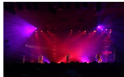
アイドルライブ（ベルサール秋葉原）