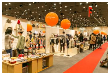
子ども用品展示会（ベルサール渋谷ガーデン）