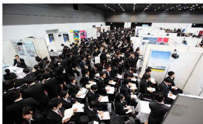
就職博覧会（ベルサール新宿グランド）