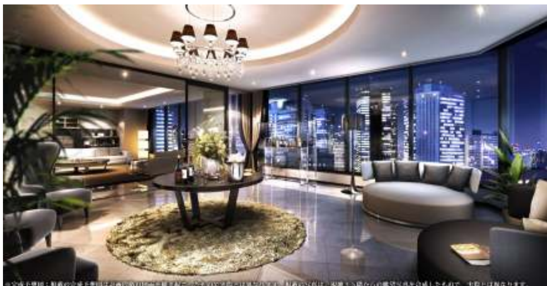
44階 ペントハウス住戸 完成予想CG

住戸プランは暮らし方や用途に合わせて選べるよう、サービスアパートメント(家具付短期)、防音部屋付き住戸、デザイナー住戸、SOHO住戸、ビューバス付住戸や最上階のペントハウスなど多彩なプランバリエーションを揃えています。また、面積や間取り、カラーセレクト（5種類）なども数多くご用意しました。