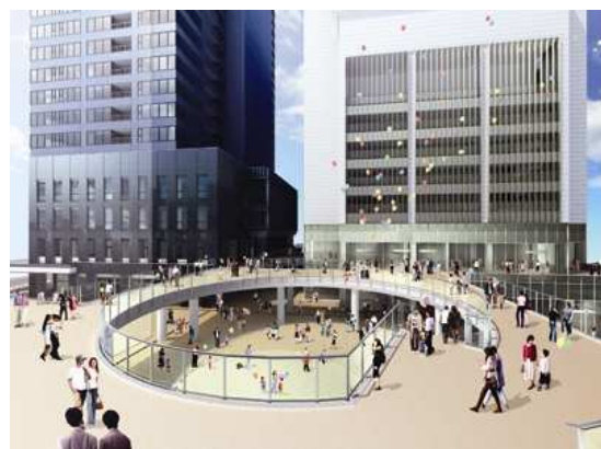
【ペDESTリアンデッキ】完成予想イメージ図