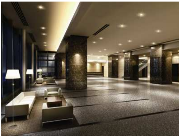
【グランドエントランス】完成予想イメージ図

グランドエントランスは、天井高約3.7mの採光に優れた開放的な空間。格式あるホテルに足を踏み入れたときに感じる、歓待への深い満足感があります。大きな窓からあふれんばかりの光が注ぎ、オーナーを、ゲストをお迎えするとともに、その先に広がるタワーライフへの期待感をにじませます。また、けやき通り側には、友人との待ち合わせなどにも便利なソファを配置。ゆとりと寛いだ時間をお過ごしいただけます。