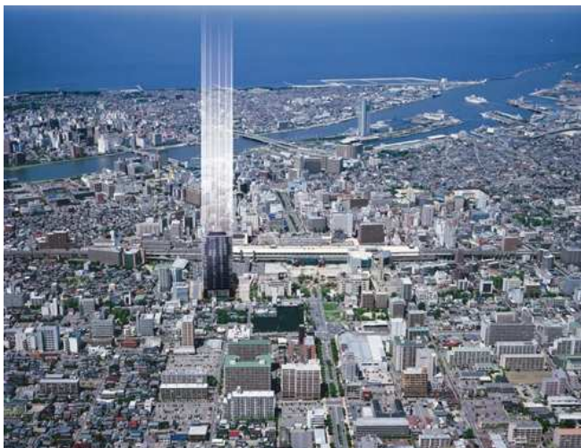
「シティタワー新潟」完成予想イメージ図

「シティタワー新潟」、都市機能を享受することのできるこの絶好のポジショニングと高級感あふれる充実の居住環境は、ビジネスやレジャー、日々の暮らしにゆとりと高い利便性をもたらしてくれることでしょう。