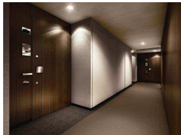
【内廊下】完成予想イメージ図