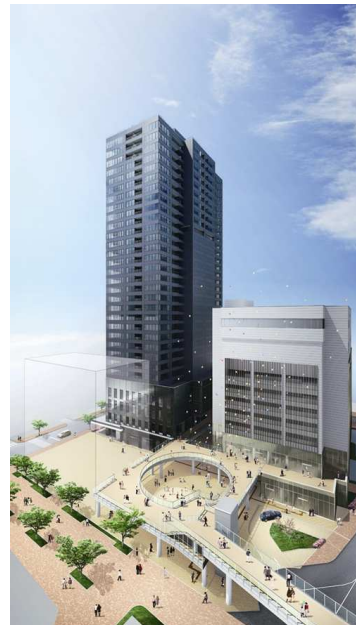
[ペDESTリアンデッキ]完成予想イメージ図