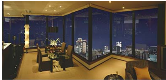
リビング・ダイニング~ダイレクトパノラマウインドウ