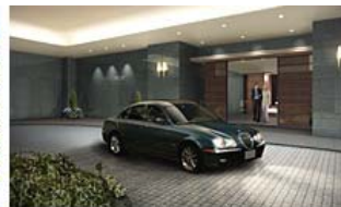
カーエントランス(車寄せ)