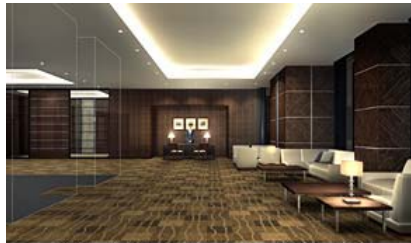
8階スカイエントランスのコンシェルジュカウンター