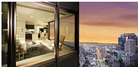
リビング・ダイニング~外部より