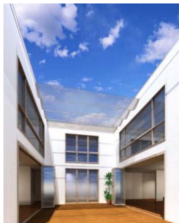
内に開いたプライベートパティオ